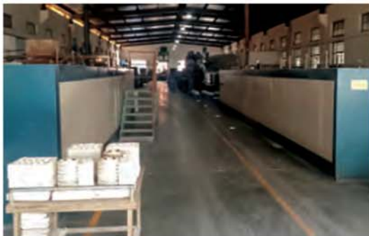
سخت کاری اکسید آلومنیوم