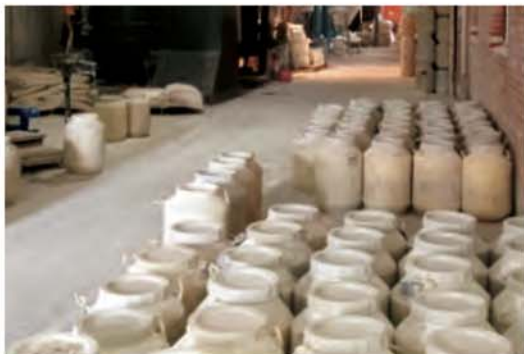
خرد کردن و پودر سازی