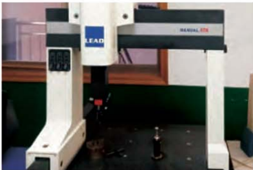
اندازه گیری ابعاد سیل