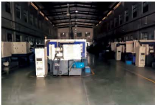
برشکاری با CNC