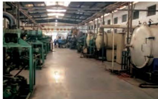
سخت کاری سیلیکون و تنگستن