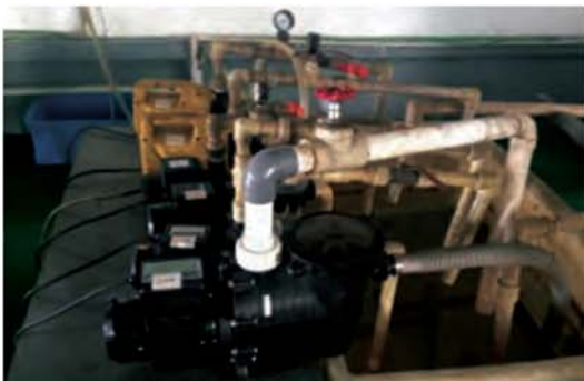
سیستم تست سیل