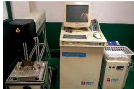
نشانه گذاری لیزری