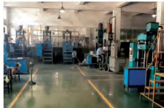
فشردن پودر خشک