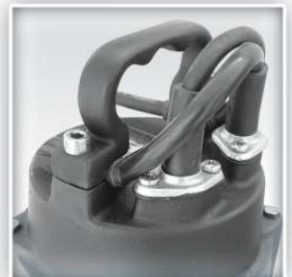
همراه با (کابل اورلود) حرارتی

پمپ کف کش تمام چدنی مدل S-32-AX با دو پروانه بسته از جنس استنلس استیل و سیلهای سیلکون کارباید با توجه به بهره گیری از استانداردهای بین المللی همچون استاندارد مدیریت کیفیت ISO 9001-2008 و همچنین داشتن استاندارد بین المللی CE اروپا تحت دستورالعمل های EN-ISO 60335-2-41, EN-ISO 60335-1, BS-EN-ISO 9906 و نیز داشتن استاندارد ملی ایران با توجه به دستورالعمل های تعیین شده ISIRI 7817, ISIRI 1562 -1, ISIRI 1562 -2-41 و نیز داشتن استاندارد آزمایشگاه معتبر و مجهز سیالات زیر نظر استاندارد مخصوص ISO -IEC 17025 - 2005 برای تخلیه آب در ساختمان ها و صنایع که نیازمند کار متوالی و دائمی همچون سیستم های تهویه مطبوع و ابروشرها هستند با تکنولوژی ویژه ای طراحی و ساخته شده است . پمپ فوق در مدل سه فاز ( 380 V ) بصورت ساده و یا همراه با اورلود حرارتی " ترموگارد " عرضه می گردد.