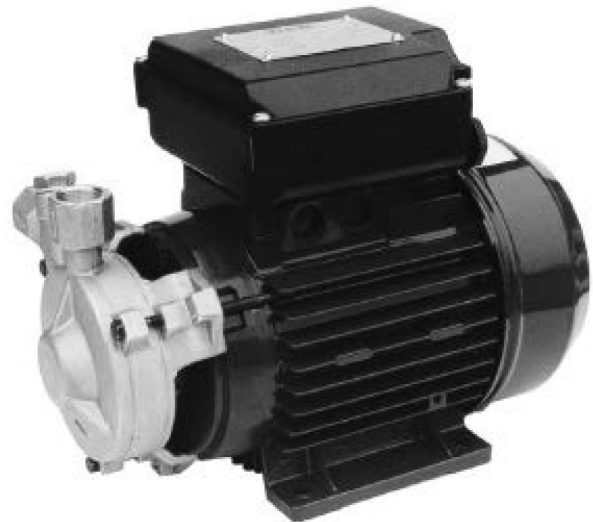
KP 60/6 - KP 60/12